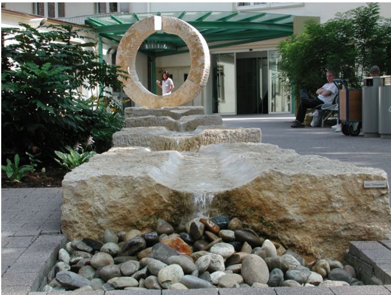
Abbildung: Der durch den Künstler Karl Infeld gestaltete Brunnen im Innenhof